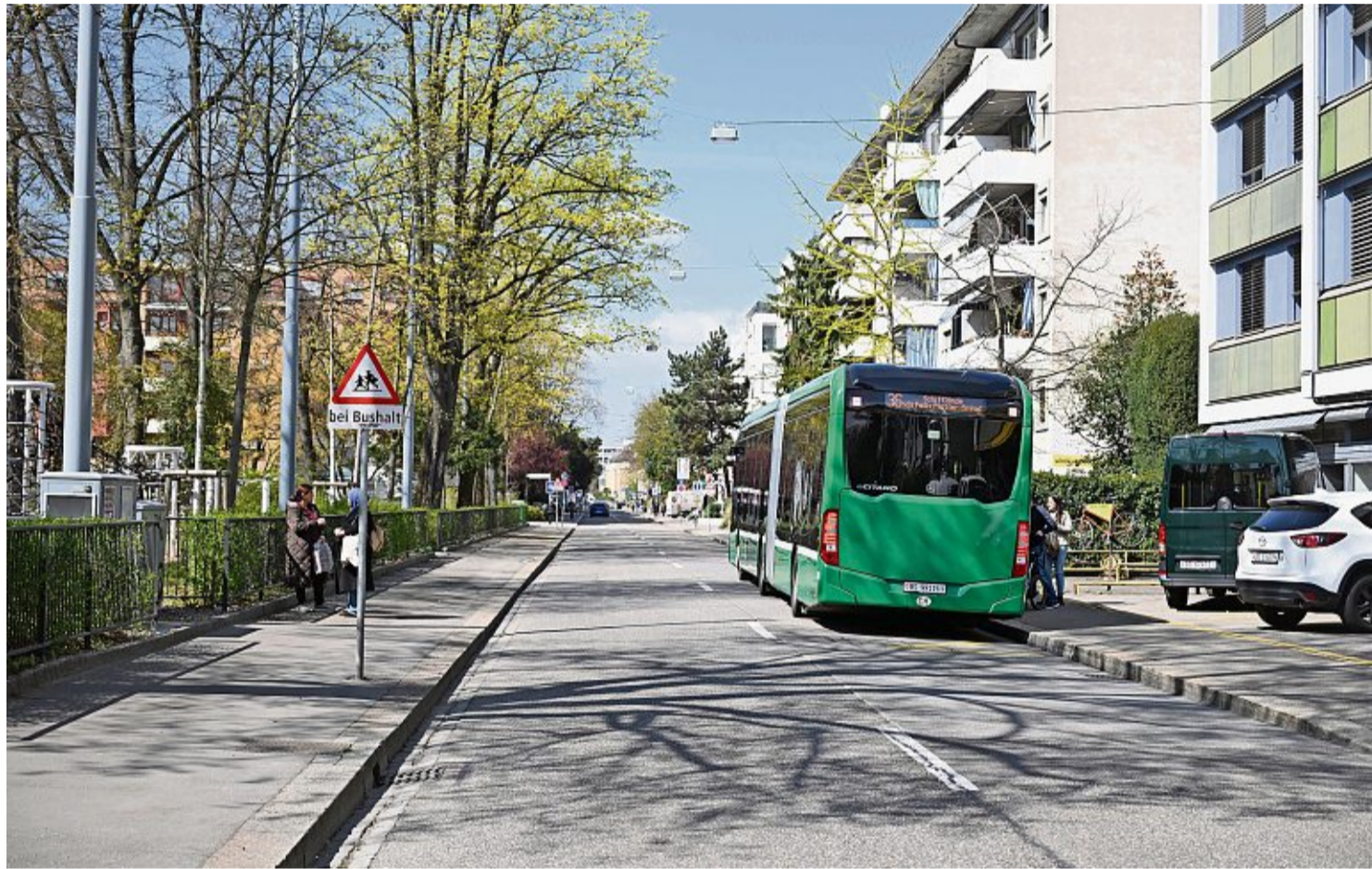
In der Dornacherstrasse müssen auch die BVB künftig langsamer fahren. So will es die Basler Regierung.

Gilt also im Umkehrschluss, dass wegen der längeren Fahrzeiten im Basler ÖV Passagiere fernbleiben? Nicole Ryf, Sprecherin des Basler Bau- und Verkehrsdepartements (BVD), winkt ab: «Wir gehen nicht davon aus, dass ÖV-Fahrgäste aufgrund von da und dort leicht längeren Fahrzeiten auf das Auto umsteigen, zumal man mit dem Auto nicht schneller unterwegs ist.»